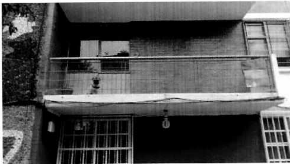
Ejemplar canino motivo de denuncia

En este sentido, se presentó a comparecer el presunto responsable del ejemplar canino objeto de investigación, quien manifestó que únicamente lo deja en el balcón el tiempo en que va a trabajar ya que la mayoría del tiempo se encuentra en el interior del inmueble; es alimentado dos veces al día con croquetas y cuenta con agua limpia a libre acceso.