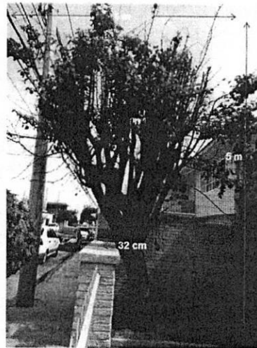
Árbol número 2