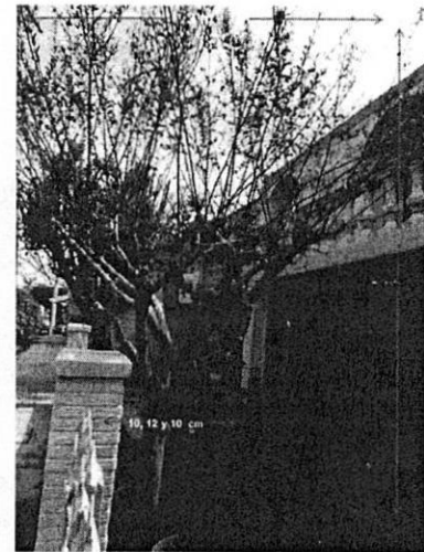
Árbol número 3

En conclusión, de la investigación realizada por esta Entidad se tiene que en el domicilio ubicado en calle Siena número 90, colonia Real del Sur, Alcaldía Tlalpan, preexisten 3 individuos arbóreos en pie, sin que los mismos contaran con alguna sustancia que pudiera afectarlos, no obstante es importante señalar que a 2 de ellos se les realizaron diversos desmoches que pueden provocar que sufran estrés y sean más vulnerables a plagas y enfermedades. -----