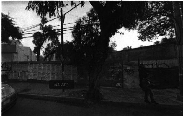
Imagen No. 3 – Predio objeto de investigación, en el cual se observa delimitado por tapiales.