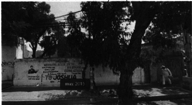
Imagen No. 5 - Predio objeto de investigación, en el cual se observa delimitado por tapiales.