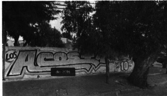
Imagen No. 6 – Predio objeto de investigación, en el cual se observa delimitado por tapiales.