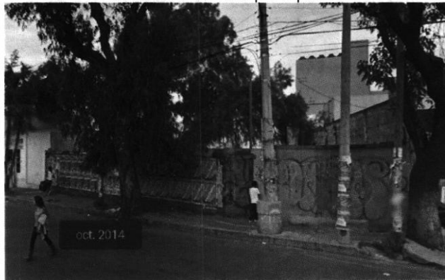
Imagen No. 4 – Predio objeto de investigación, en el cual se observa delimitado por tapiales.