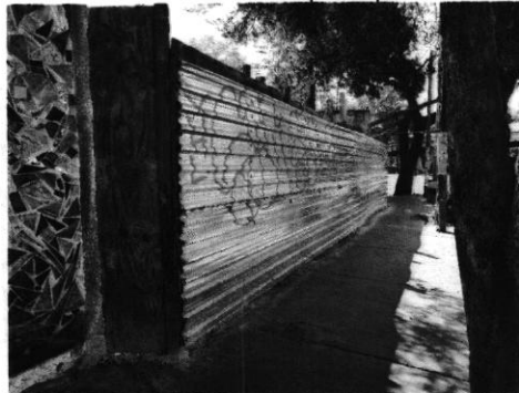
Imagen No. 8 – Predio objeto de investigación, en el cual se observa delimitado por tapiales.