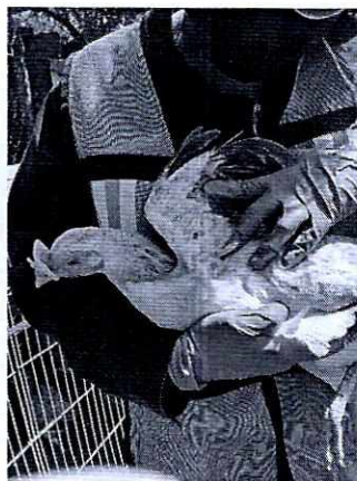
Fotografías 9 y 10. Lugar de alojamiento de las aves y revisión física de los gallos y gallinas.