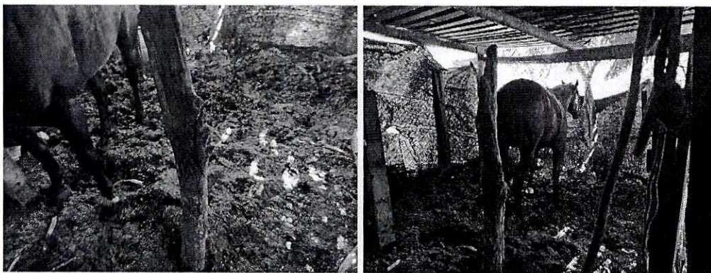
Fotografías 3 y 4. Lugar de alojamiento inadecuado.