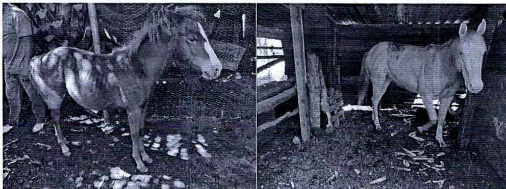
Fotografías 1 y 2. Ejemplares con lesión en el miembro pélvico derecho y en piel.