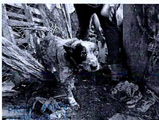
Fotografías 11 a 14. Ejemplares caninos y sus condiciones de alojamiento.