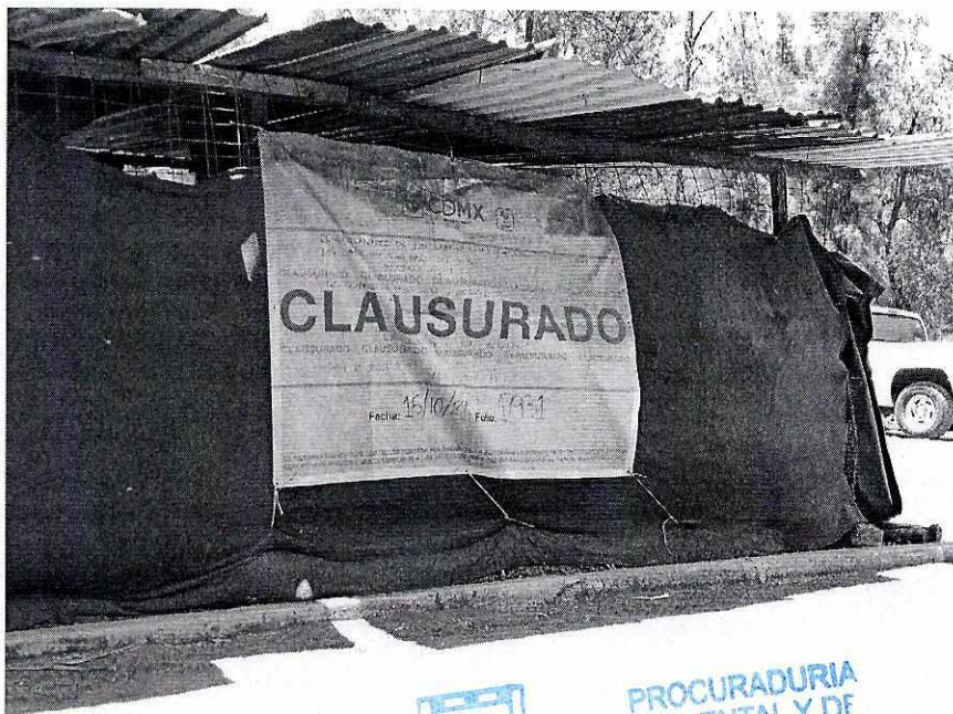
Fotografía 15. Lona de la Secretaría de Medio Ambiente SEDEMA "Clausurado" con folio 17931, de fecha 15 de octubre de 2021.

En seguimiento de lo anterior, personal de esta Subprocuraduría llevó a cabo una nueva visita de reconocimiento de hechos con la finalidad de dar seguimiento a las recomendaciones antes mencionadas, constatando que un ejemplar canino fue dado en adopción y los restantes contaban con agua a su libre disposición; por su parte, los ejemplares equinos que presentaban condiciones dermatológicas y el que contaba con una lesión en el miembro pélvico derecho, habían recibido las atenciones médico-veterinarias necesarias para mejorar su condición de salud; en el acto, se observó una lona con la leyenda de "CLAUSURADO" con folio 17931 de fecha 15 de octubre de 2021, impuesta por la Secretaría del Medio Ambiente de la Ciudad de México; al respecto,