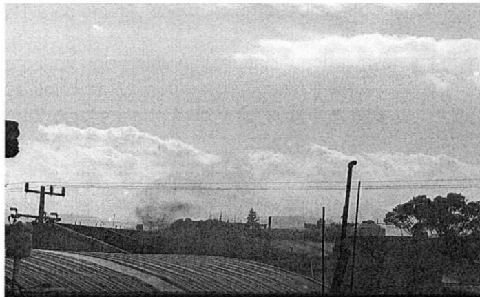
Chimenea de la industria en funcionamiento

Ahora bien, las personas denunciantes informaron a esta Entidad que la industria reinició actividades y que durante su operación continua contaminando, remitiendo material fotográfico y videograbado del establecimiento denunciado, en el que se observa que aun cuenta con sellos de clausura, sin embargo se reanudaron actividades, observando la entrada y salida de vehículos en diferentes horas del día, así como que sus chimeneas continúan expulsando humo negro, por lo que asumen que la fábrica no ajusto sus actividades en apego a la normatividad ambiental, y que los contaminantes que se generan no permiten un desarrollo saludable para los vecinos, como a continuación se muestra: -----