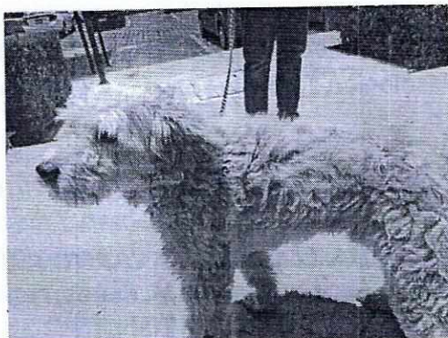
Fotografía: vista del ejemplar canino observado en el inmueble.

Por lo anteriormente señalado esta Subprocuraduría Ambiental, de Protección y Bienestar a los Animales, da por concluida la investigación de los hechos que nos ocupan en apego al artículo 27 fracción VI de la Ley Orgánica de la Procuraduría Ambiental y del Ordenamiento Territorial de la Ciudad de México, por imposibilidad legal, al no constatar irregularidades en materia de bienestar animal.