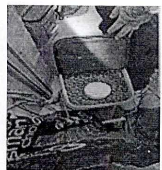
Imágenes 1 a 4. Exterior del inmueble, ejemplar canino, casa para resguardo y recipiente de croquetas.

Es de resaltar que, en el Acuerdo de Admisión, que fue enviado por correo electrónico a las personas denunciantes, se les hizo de conocimiento que contaban con un término de seis días hábiles para aportar las pruebas que estimaran pertinentes en la investigación de los hechos, lo anterior conforme al artículo 90 del Reglamento de la Ley Orgánica de la Procuraduría Ambiental y del Ordenamiento Territorial de la Ciudad de México; sin embargo durante el procedimiento de investigación, no fueron proporcionados elementos de prueba que pudieran determinar incumplimiento a la normatividad en materia de bienestar animal.