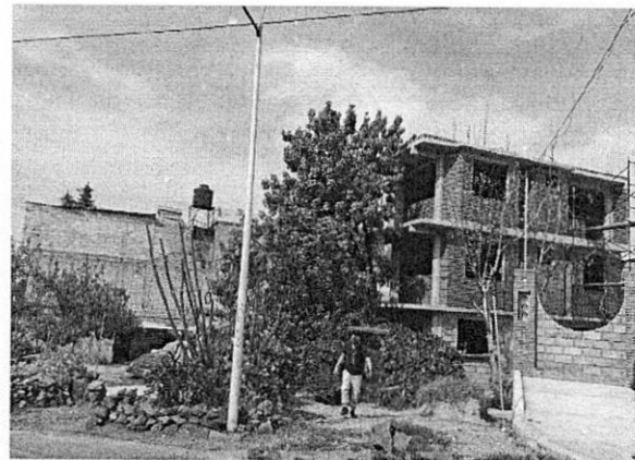
Reconocimiento de hechos de fecha 05 de noviembre de 2021

Es decir, el inmueble de 3 niveles es el único de reciente construcción. -----