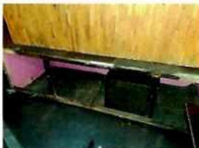
Figuras 2 y 3. Establecimiento mercantil denunciado.

Resultante de lo observado en la diligencia llevada a cabo el 23 de marzo de 2022, se determina mediante Acuerdo con número de folio PAOT-05-300/200-3759-2022 de fecha 23 de marzo de 2022, que es procedente