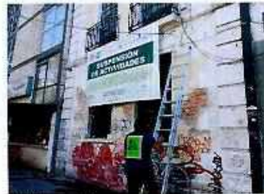
Figuras 2 y 3. Establecimiento mercantil denunciado.

Medellín 202, piso 4, colonia Roma Sur Alcaldía Cuauhtémoc, C.P. 06000, Ciudad de México Tel. 5265 0780 ext 12011 Y 12400