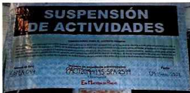
Figuras 1 y 2. Establecimiento mercantil denunciado.

En seguimiento a la denuncia, mediante escrito presentado en esta Entidad en fecha 08 de marzo de 2022, el representante legal del establecimiento mercantil con nombre comercial "M.N ROY" ubicado en calle Mérida, número 186, colonia Roma Norte, Alcaldía Cuauhtémoc, informó lo siguiente: