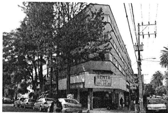
Reconocimiento de hechos de fecha 25 de noviembre de 2021.