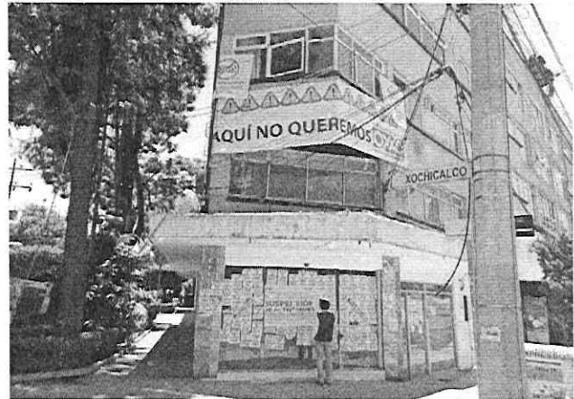
Reconocimiento de hechos de fecha 12 de mayo de 2022.

Por otra parte, de conformidad con el artículo 47 del Reglamento de Construcciones para la Ciudad de México, para construir, ampliar, reparar o modificar una obra o instalación de las señaladas en el artículo 51 de ese ordenamiento, el propietario o poseedor del predio o inmueble, en su caso, el Director Responsable de Obra y los Corresponsables, previo al inicio de los trabajos debe registrar la manifestación de construcción correspondiente. -----