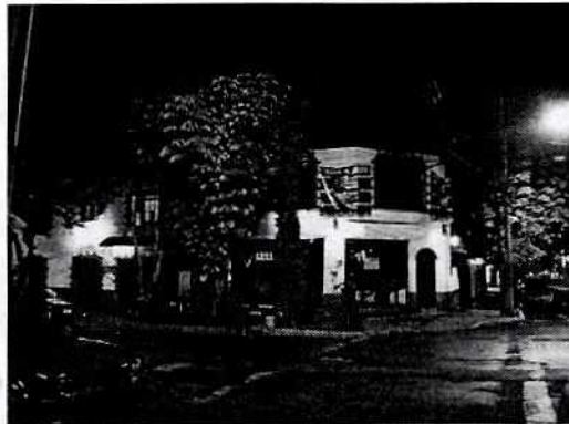
En la imagen se observa el negocio con nombre comercial "Grill & Beer".

Se solicitó estudio de emisiones sonora a la Dirección de Estudios y Dictámenes de Protección Ambiental de esta Procuraduría estudio de emisiones sonoras informando que se comunicaron con la persona denunciante con la finalidad de agendar fecha y hora para llevar a cabo un estudio de emisiones sonoras desde el punto de denuncia; sin embargo, la persona denunciante refirió que el establecimiento mercantil con nombre comercial "Grill & Beer" ya no se encuentra en operación, toda vez que actualmente en dicho sitio hay una tienda de abarrotes, siendo corroborado su dicho mediante correo electrónico.