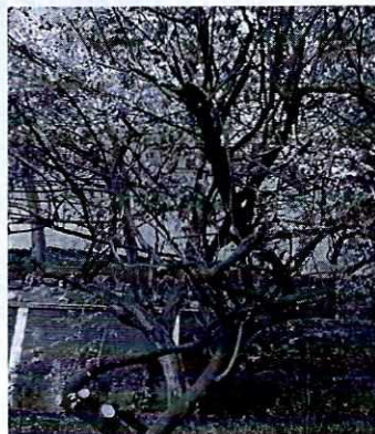
Se muestra el individuo arbóreo podado.

En este sentido, de las constancias que obran en el presente expediente, se desprende que personal adscrito a esta Procuraduría llevó a cabo el reconocimiento de hechos establecido en el artículo 15 BIS 4 fracción IV de la Ley Orgánica de esta Entidad, diligencia en la que se constató la poda de dos ramas secundarias de un árbol de la especie Schinus terebinthifolius ; así como, el retiro de diversos arrayanes; por lo que se notificó el citatorio correspondiente a la persona señalada como responsable de los hechos denunciados.