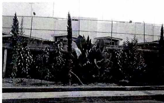
Se muestra el área verde restaurada y los árboles plantados

En virtud de lo anterior y toda vez que la responsable de la afectación motivo de la denuncia en cumplimiento voluntario llevó a cabo la restauración del área verde afectada y las medidas de compensación correspondientes, ésta Procuraduría considera procedente dar por concluida la investigación de conformidad con el artículo 27 fracción VII de la Ley Orgánica de esta Procuraduría.