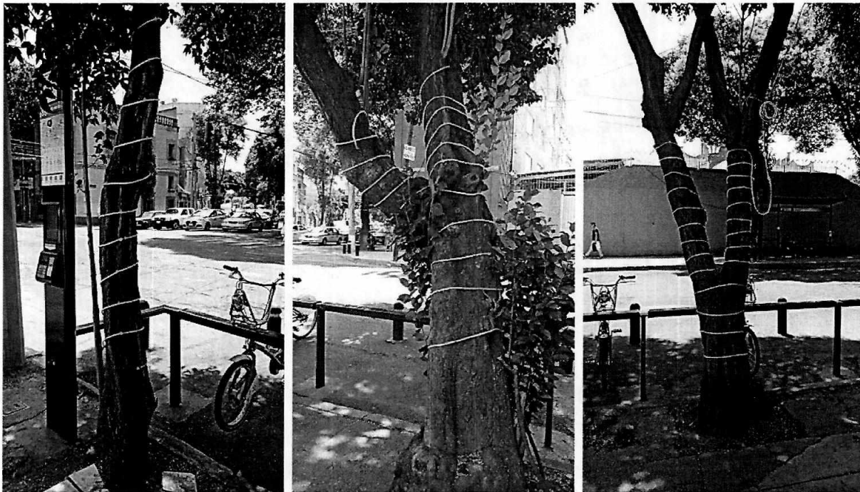
Fotografías 1 a 3. Se muestran los individuos arbóreos con mangueras clavadas en sus troncos.

Al respecto, durante visita de reconocimiento de hechos efectuada por personal de esta Entidad en el lugar señalado por la persona denunciante, se constató la presencia de tres individuos arbóreos de la especie comúnmente conocida como trueno de más de seis metros de altura cada uno, los cuales cuentan con mangueras con luces clavadas a los largo de sus troncos, constatando que la conexión de luces proviene del establecimiento mercantil denominado Grizzly Burgers and Beer, ya que se observa un cable conectado a dichas luces proveniente del interior del mismo. En virtud de lo anterior, personal de esta Entidad se entrevistó con personal del establecimiento mercantil, a quien se le manifestó el motivo de la visita, indicando que una vez que llegara el encargado en turno, retirarían de manera voluntaria las luces y clavos que les colocaron a los árboles referidos.