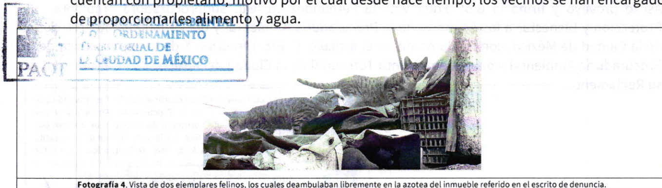
Fotografía 4. Vista de dos ejemplares felinos, los cuales deambulaban libremente en la azotea del inmueble referido en el escrito de denuncia.

Por lo anterior, y en el entendido de que los ejemplares felinos no cuentan con una persona responsable de su cuidado a la cual se le pueda exhortar el cumplimiento en materia de bienestar animal, esta Subprocuraduría se encuentra imposibilitada materialmente para continuar con la investigación de los hechos, por lo que se da por concluida con fundamento en el artículo 27 fracción III de la Ley Orgánica de la Procuraduría Ambiental y del Ordenamiento Territorial de la Ciudad de México.