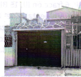
Fotografías 1 y 2. Vista de los inmuebles encontrados en la calle Combate de León, marcados con el número 51.

Por lo antes referido, mediante oficio PAOT-05-300/200-5353-2019 de fecha dos de julio del presente año, se solicitó a la persona denunciante mayor información respecto al inmueble en el cual se encuentran los ejemplares felinos motivo de queja; al respecto, mediante correo electrónico de fecha seis de julio del año en curso, informó que el número correcto del inmueble es el 31 de la calle antes referida.