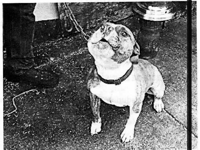
Fotografías 1 y 2. Se muestra condición corporal del ejemplar canino motivo de la presente investigación