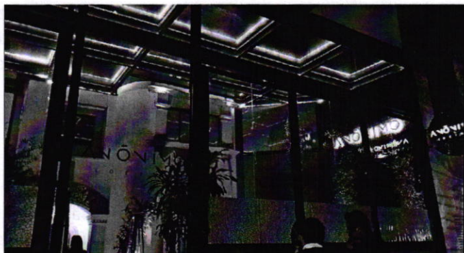
Se muestra el establecimiento motivo de la denuncia

En ese sentido, personal de esta Subprocuraduría llevó a cabo una primera visita de reconocimiento de hechos, de acuerdo a lo establecido en el artículo 15 BIS 4 fracción IV de la Ley Orgánica de esta Entidad, diligencia de la cual se levantó el acta circunstanciada correspondiente, haciendo constar que desde la vía pública se percibió la generación de emisiones sonoras producidas por música grabada, proveniente del establecimiento con giro de restaurante con venta de bebidas alcohólicas motivo de la denuncia.