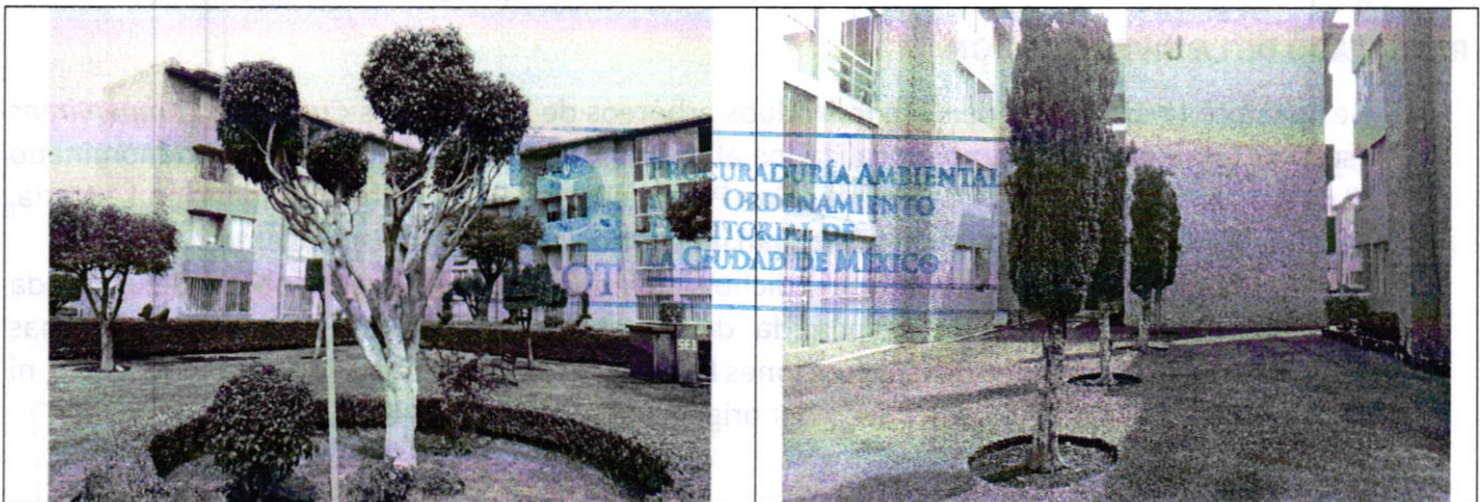
Fotografía 1. Vista del individuo arbóreo de la especie Ficus benjamina .