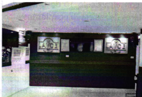
Fotografía 2. Vista de equipo utilizado para la reproducción de música.

Mediante correo electrónico de fecha veintinueve de agosto del año en curso, la persona denunciante manifestó que por cuestiones de seguridad no podía permitir el acceso a su domicilio con la finalidad de realizar el estudio de emisiones sonoras, solicitando que se llevara a cabo desde el espacio público. Al respecto, la Dirección de Estudios y Dictámenes de Protección Ambiental de esta Subprocuraduría realizó el estudio de emisiones sonoras, desde el punto de referencia, lo anterior con el objeto de determinar si excedían los límites máximos permisibles especificados en la Norma Ambiental para la Ciudad de México NADF-005-AMBT-2013.