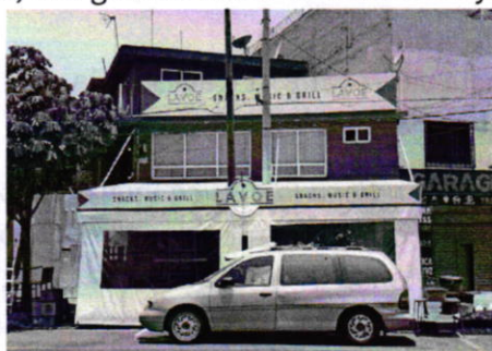
Fotografía 1. Vista del establecimiento mercantil denominado "LAVOE".

Aunado a lo anterior, y con la finalidad de contar con mayores elementos, se citó a comparecer a la persona propietaria del establecimiento mercantil en comento, quien en fecha veintiocho de junio de dos mil diecinueve, se presentó a comparecer en las oficinas de esta Procuraduría, manifestando que durante sus actividades utiliza dos bocinas tipo baffle para la reproducción de música grabada, las cuales se localizan en la vía pública; no obstante, se comprometió a realizar la reubicación y redireccionamiento de dicho equipo al interior del establecimiento mercantil en comento, así como mantener el volumen de la música únicamente ambiental.