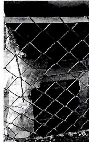
Imagen 4. Lugar de reguardo vista lateral.

Por lo anterior, toda vez que no se constataron maltratos que puedan ser constitutivos de maltrato y/o crueldad animal, debido a que a los ejemplares se les proporcionan los cuidados de bienestar animal necesarios, se da por concluida la investigación de conformidad con el artículo 27 fracción III de la Ley Orgánica de esta Procuraduría, toda vez que se han realizado todas las acciones previstas en la Ley y su Reglamento para la atención de la denuncia.