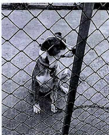
Imagen 1. Ejemplar canino motivo de denuncia.

En este sentido, personal de esta Subprocuraduría realizó un reconocimiento de hechos de acuerdo a lo establecido en el artículo 15 BIS 4 fracción IV de la Ley Orgánica de esta Entidad, en el cual se constató la existencia de un ejemplar canino, hembra de 9 años, de raza mestiza, de color café con blanco, de talla grande, la cual en el momento de la visita estaba en la azotea, amarrada con una correa de aproximadamente 2.5 metros de largo, el poseedor de los ejemplares indicó que está amarrada debido a que cuando hay pirotecnia la perrita se espanta y puede saltar de la azotea y debido a que ellos trabajan y o la pueden cuidar en el día la sueltan en la noche y fines de semana, también cuenta que hace aproximadamente 5 meses tuvo una camada de 8 perritos (los cuales fueron colocados en diferentes hogares), debido a su edad y la cantidad de cachorros que parió su recuperación fue más lenta, tiene una condición corporal ideal (3/5), tiene una casa de madera y lámina hecha por el hijo de la propietaria en donde se resguarda de la intemperie, es alimentada con croquetas dos veces al día, cuenta con un recipiente de agua limpia a libre acceso y su comportamiento es responsivo sin muestras de estrés, mencionó que cuentan con atención médica veterinaria, mostrándonos sus cartillas de vacunación y desparasitación adecuada a su edad.