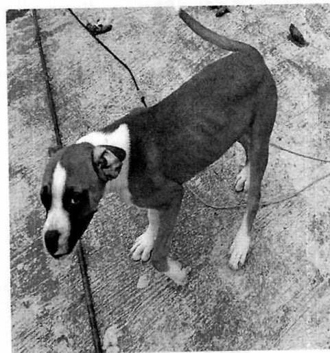
Fotografía 2. Ejemplar canino bóxer de nombre "Toby", en la azotea del domicilio.

Por lo anterior, toda vez que no se constataron maltratos que puedan ser constitutivos de maltrato y/o crueldad animal, debido a que a los ejemplares se les proporcionan los cuidados de bienestar animal necesarios, se da por concluida la investigación de conformidad con el artículo 27 fracción III de la Ley Orgánica de esta Procuraduría toda vez que se han realizado todas las acciones previstas en la Ley y su Reglamento para la atención de la denuncia.