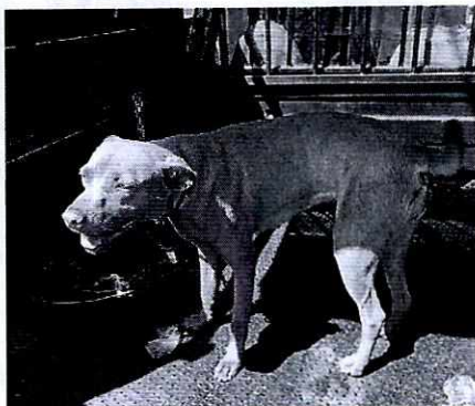
Imagen 1. Ejemplar canino motivo de denuncia.

La canina presenta una condición corporal ideal y su comportamiento es responsivo sin muestras de estrés, no hay señales de heridas en piel, solamente cuenta con una oreja debido a que así la encontraron cuando era una cachorra, cuentan con un recipiente para agua que se encuentra a su libre acceso y disposición, el poseedor indicó que se le proporciona una vez al día alimento. Aunado a lo anterior, mencionó que cuentan con atención médica veterinaria, mostrándonos comprobantes de vacunación y desparasitación de la Alcaldía.