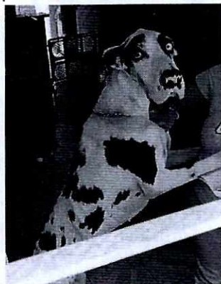
Imagen 1. Ejemplar canino motivo de denuncia.

La canina responde al nombre de "Lola", presenta una condición corporal baja, debido a que tiene una enfermedad que la hace perder peso progresivamente, esta enfermedad fue diagnosticada por un médico veterinario zootecnista en el mes de febrero y está en tratamiento para subir de peso, el propietario indicó que se le proporciona dos veces al día (a base de papas y carne de cerdo, la dieta es la que le recomendó su médico veterinario); aunado a lo anterior, mostró su receta médica en donde se observan las indicaciones dietéticas del ejemplar a seguir, su comportamiento es responsivo sin muestras de estrés, cuentan con un recipiente para agua que se encuentra a su libre acceso y disposición.