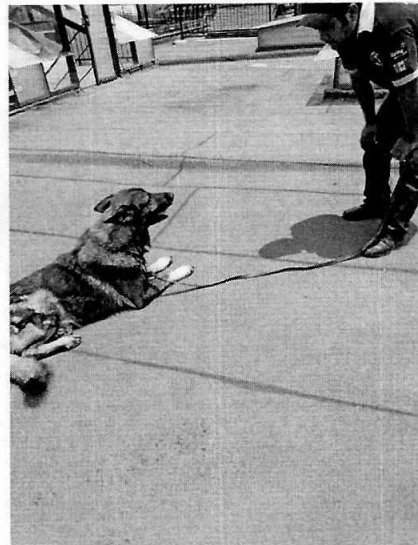
Fotografía 2. Ejemplar canino pastor alemán, el cual sacaron de su jaula para dar una demostración de su entrenamiento.

Por lo anterior, debido a que en ese momento no se encontraba el tercer ejemplar canino referido en el escrito de denuncia, se realizó una nueva con la finalidad de constatar las condiciones del mismo. En dicha visita se