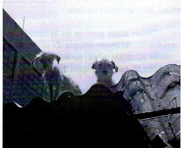
Imágenes 1 y 2. "Daisy" con el lazo con el lazo que limitaba su movilidad amarraba y "Balnquita" y "Pequeña" en la azotea.