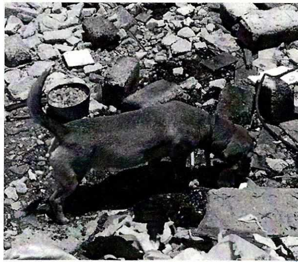
Imágenes 3 y 4. “Pequeña” y “Daisy” libres en la parte baja del inmueble.

En cuanto a su comportamiento, las caninas mantienen una postura relajada y contacto visual sin manifestar agresión, asimismo, permiten el contacto físico del personal actuante y de su propietario, además, se muestran dispuestos al juego de manera inmediata, en este sentido, derivado del comportamiento exhibido por los animales se deduce que no existen síntomas de estrés o aislamiento.