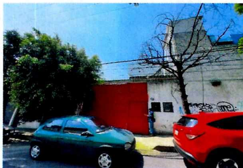
Figura 1. Vista del establecimiento mercantil motivo de denuncia.

En este sentido, de las constancias que obran en el presente expediente, se desprende que personal de esta Procuraduría llevó a cabo una visita de reconocimiento de hechos, de acuerdo a lo establecido en el artículo 15 BIS 4 fracción IV de la Ley Orgánica de esta Entidad, diligencia durante la cual desde el espacio público se observó que el establecimiento mercantil con denominación comercial "Dünnpharma" S.A. de C.V., se encontraba en funcionamiento; sin embargo, desde el espacio público no se constató la generación de emisiones sonoras por el funcionamiento de un extractor que fueran susceptibles de medición acústica; no obstante, se procedió a notificar el oficio PAOT-05-300/200-2731-2021.