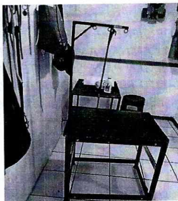
Fotografías 1-2. Se observa el interior del local comercial objeto de investigación, no se observó algún ejemplar canino

Medellín 202, piso 4, colonia Roma Norte Alcaldía Cuauhtémoc, C.P. 06700, Ciudad de México Tel. 5265 0780 ext 12011 y 12400