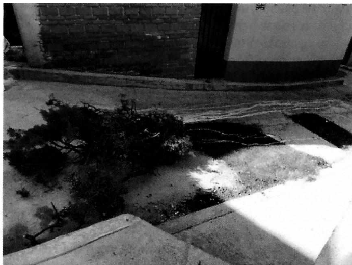
Fotografías 1 y 2. Individuo arbóreo objeto de la presente investigación.

Derivado de lo antes señalado, la Dirección General de Servicios Urbanos de la Alcaldía Álvaro Obregón, informó mediante oficio a esta Subprocuraduría que la Coordinación de Operación, Parque y Jardines de esa Unidad Administrativa, hizo de conocimiento no contar con algún antecedente, orden de trabajo o autorización para el derribo del sujeto arbóreo motivo de la presente investigación. En ese tenor de ideas, se desprende que corresponde a esa autoridad, gestionar la compensación conforme a lo establecido en la normatividad ambiental aplicable.