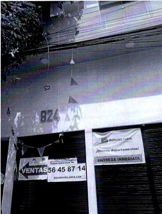
Fotografía 1. Se observa fachada y número 924 del edificio ubicado sobre la calle Tokio, Colonia Portales Sur, Alcaldía Benito Juárez