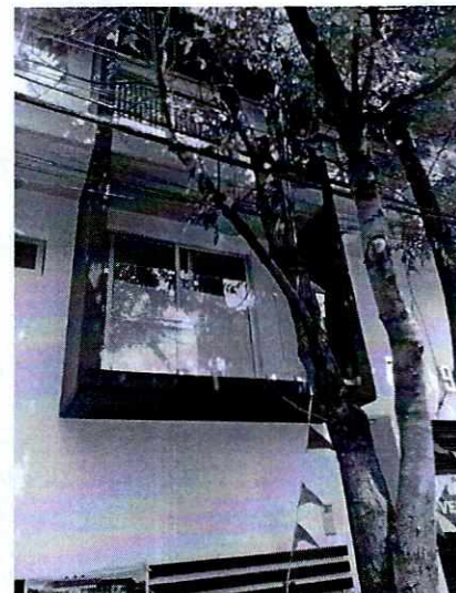
Fotografía 2 y 3. Se observa balcón del primer nivel del condominio ubicado en calle Tokio, Colonia Portales Sur, Alcaldía Benito Juárez.