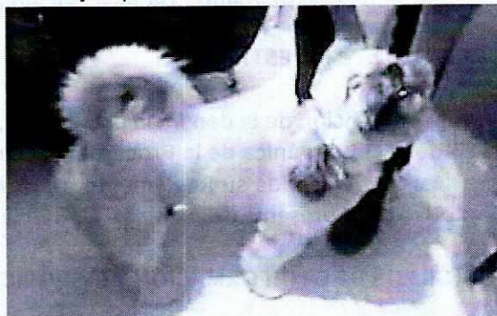
Fotografía 1. Se muestra ejemplar canino motivo de la presente investigación.

En seguimiento a la denuncia, se acudió nuevamente al domicilio a corroborar lo indicado por la persona responsable del cánido, en la cual se constató la presencia de un ejemplar canino de raza ihasa apso, de aproximadamente 8 años de edad, que responde al nombre de Lucca, el cual cuenta con pelaje color blanco, mismo que cuenta con una condición corporal ideal, al cual se le proporciona dos veces al día alimento, contando con agua limpia para beber, siendo que el alojamiento es al interior del inmueble, el cual se observa limpio, libre de heces, es de señalar que al momento de la visita el ejemplar se encontraba deambulando libre al interior del predio. Es de señalar que el cánido no cuenta con lesiones evidentes y presenta un comportamiento sociable y responsivo, sin signos de temor y estrés. Asimismo, la responsable del cánido exhibe la cartilla de vacunación.