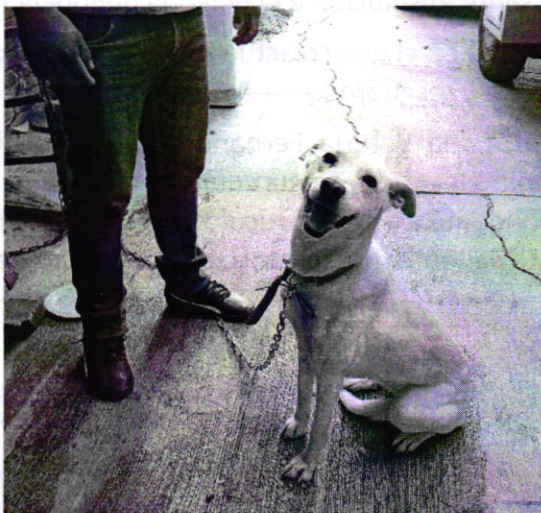
Fotografía 2. Vista del ejemplar canino motivo de denuncia.

persona propietaria del animal de compañía, actualmente presenta una condición corporal ideal de acuerdo a su talla, ya que no se observan las costillas ni protuberancias óseas, de igual forma se extendió la longitud de su correa, midiendo actualmente tres metros, la cual le permite tener la movilidad suficiente de acuerdo a su talla.