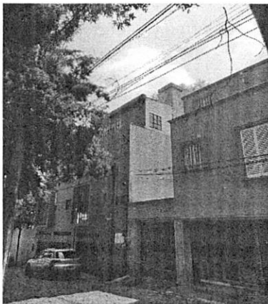
Fuente: Imagen de fecha 13 de agosto de 2021 obtenida durante el reconocimiento de hechos