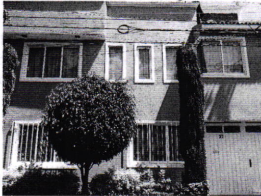
Fotografía 1. Vista del inmueble referido en el escrito de denuncia.

En este sentido, personal de esta Subprocuraduría realizó un reconocimiento de hechos de acuerdo a lo establecido en el artículo 15 BIS 4 fracción IV de la Ley Orgánica de esta Entidad, durante el cual no fue posible ingresar al domicilio antes referido; no obstante, con la finalidad de contar con mayores elementos, se citó a comparecer al propietario del ejemplar canino motivo de denuncia, quien en fecha dieciséis de octubre de dos mil diecinueve, se presentó en las oficinas de esta Procuraduría, manifestando que cuenta con un animal de compañía el cual recibe los cuidados de bienestar animal correspondientes, asimismo hizo entrega del certificado médico correspondiente.