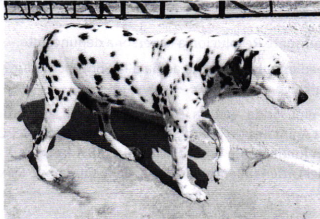
Fotografía 2. Vista del ejemplar canino que responde al nombre de "Bongo".

por edad avanzada; al respecto, la persona propietaria del ejemplar canino mostró el certificado de salud actualizado.