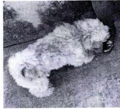
Fotografías que muestran al ejemplar motivo de la presente investigación.

En virtud de lo antes expuesto esta Entidad considera procedente emitir la presente resolución, de conformidad con el artículo 27 fracción VI, de la Ley Orgánica de la Procuraduría Ambiental y del Ordenamiento Territorial de la Ciudad de México, por imposibilidad legal, al no constatar irregularidades en materia de bienestar animal.