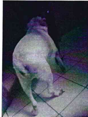
Imágenes 3.- "Cuco"

No. de Folio: PAOT-05-300/200-12540-2019