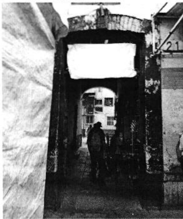
Fotografía 1. Fachada del sitio denunciado