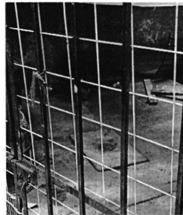
Fotografías 2 y 3. Ejemplares caninos denunciados.

Es de resaltar que, en el Acuerdo de Admisión, que fue enviado por correo electrónico a la persona denunciante, se le hizo de conocimiento que contaba con un término de seis días hábiles para aportar las pruebas que estimara pertinentes en la investigación de los hechos, lo anterior conforme al artículo 90 del Reglamento de la Ley Orgánica de la Procuraduría Ambiental y del Ordenamiento Territorial de la Ciudad de México; sin embargo durante el procedimiento de investigación, no fueron proporcionados elementos de prueba que pudieran determinar incumplimiento a la normatividad en materia de bienestar animal.