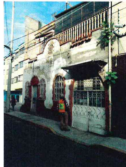
Figura 1 y 2. Lugar de los hechos denunciados.

En seguimiento de lo anterior, personal de esta Subprocuraduría informó a la persona denunciante que durante visita de reconocimiento de hechos no se constató la presencia de los ejemplares caninos en el sitio señalado en su denuncia, por lo que los hechos que motivaron su denuncia dejaron de existir.