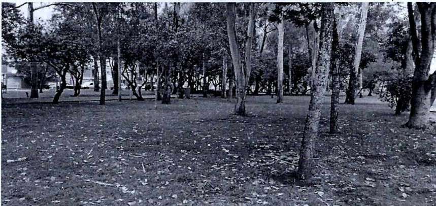
Fotografía 2. Área verde del Parque Santa Cecilia.

No obstante lo anterior, personal de esta Entidad realizó otro reconocimiento de hechos con la persona denunciante, en la cual no se observó acumulación de residuos que estén afectando el área verde del parque en comento. En ese acto, la persona denunciante refirió que los residuos motivo de su denuncia, ya no se encontraban en el sitio; es de señalar que en el momento de la visita solo se constató la presencia del personal de la Alcaldía realizando trabajos de limpieza y mantenimiento del área verde del Parque Santa Cecilia.