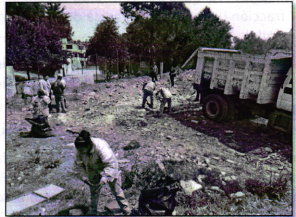
Fotografía 2. Vista del sitio referido en el escrito de denuncia.

Por lo anterior, personal del Área de Información y Estudios Ambientales de la demarcación territorial La Magdalena Contreras en conjunto con esta Entidad, realizó una jornada de limpieza.