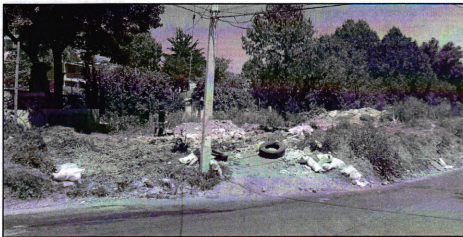
Fotografía 1. Vista del sitio referido en el escrito de denuncia.

Sobre el tema, es de indicar que de la consulta realizada en el Sistema de Información del Patrimonio Ambiental y Urbano de la CDMX (SIG PAOT), se desprende que el sitio de denuncia se encuentra fuera de algún polígono que haya sido decretado como un Área de Valor Ambiental o Área Natural Protegida.