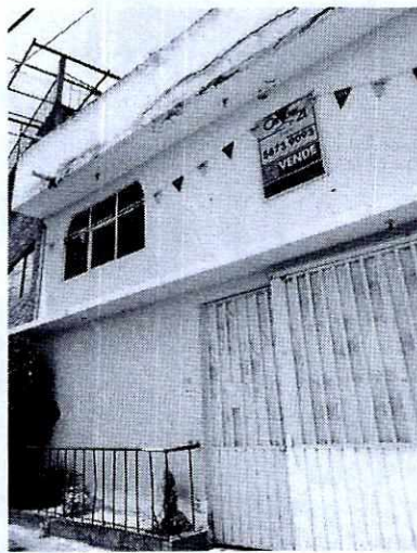
Fotografía 1. Lugar donde presuntamente ocurren los hechos.

En seguimiento a la denuncia, personal de esta Subprocuraduría realizó dos reconocimientos de hechos más, en los cuales no fue posible establecer comunicación con el habitante del domicilio y no se constató la presencia de olores u ladridos característicos de ejemplares caninos.