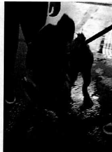
Fotografías 1 y 2. "Hanna" y "Félix" respectivamente.

Por todo lo anterior, considerando que los ejemplares caninos reciben las condiciones de bienestar animal necesarias, y toda vez que no quedan actuaciones pendientes por parte de esta Subprocuraduría Ambiental, de Protección y Bienestar a los Animales para el caso que nos ocupa, se procede a dar por concluida la investigación de la denuncia ciudadana bajo el número de expediente citado al rubro, con fundamento en el artículo 27 fracción III de la Ley Orgánica de la Procuraduría Ambiental y del Ordenamiento Territorial.