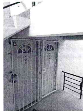
Imagen 2. -Puerta del domicilio.

Aunado a lo anterior, se sostuvo llamada telefónica con la persona denunciante, quien confirmó que el ejemplar canino motivo de denuncia ya no se encuentra en el domicilio de referencia.