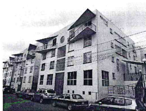
Imagen 1. Foto del domicilio vista vía pública

Por lo anterior, se presentó a comparecer una persona del sexo masculino quien refirió ser el propietario del inmueble motivo de la denuncia, refirió que él tuvo un ejemplar canino pug, sin embargo ya no habita el domicilio antes mencionado desde el mes de agosto, fecha en la que fue enviado a vivir con la conyugue e hijo de la persona que asistió a la comparecencia, esto en el Estado de Veracruz.