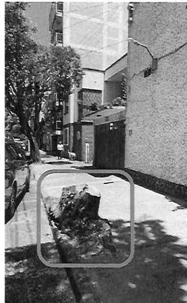
Imágenes 1 y 2. Se resalta estado en el cual se encontraba el individuo arbóreo objeto de investigación (izquierda). Imagen fechada del mes de julio de 2021. Asimismo, se muestra tocón actual en el sitio en comento (derecha).

Por lo anterior, se solicitó mediante oficio a la Dirección Ejecutiva de Servicios Urbanos de la Alcaldía Benito Juárez, que informara si en los archivos de esa autoridad, contaba con antecedentes relacionados para la autorización del derribo del árbol antes descrito, así como el dictamen y restitución correspondiente, y que en caso de no haber emitido autorización alguna, gestionara la compensación conforme a lo establecido en la normatividad ambiental aplicable, remitiendo copia simple de las documentales generadas en el proceso.