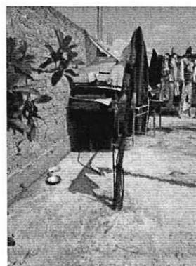
Fotografías 1 a 3. Se muestra ejemplar canino, sitio de alojamiento y refugio