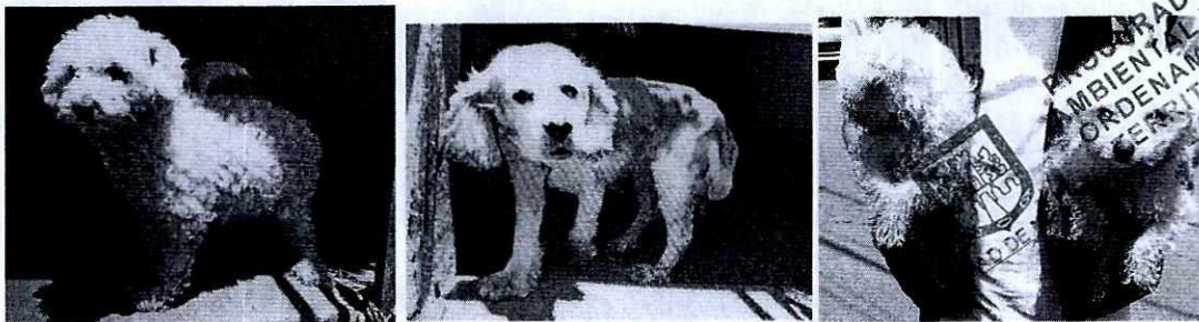
Fotografías.- vista de los ejemplares caninos alojados en el inmueble

Medellín 202, piso 4, colonia Roma Alcaldía Cuauhtémoc, C.P. 06700, Ciudad de México Tel. 5265 0780 ext. 12400/12011