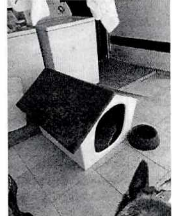
Fotografías 1-6. Ejemplares motivo de denuncia y lugar de alojamiento.

Es de resaltar que, en el Acuerdo de Admisión, que fue enviado por correo electrónico a la persona denunciante, se le hizo de conocimiento que contaba con un término de seis días hábiles para aportar las pruebas que estimara pertinentes en la investigación de los hechos, lo anterior conforme al artículo 90 del Reglamento de la Ley Orgánica de la Procuraduría Ambiental y del Ordenamiento Territorial de la Ciudad de México; sin embargo durante el procedimiento de investigación, no fueron proporcionados elementos de prueba que pudieran determinar incumplimiento a la normatividad en materia de bienestar animal.