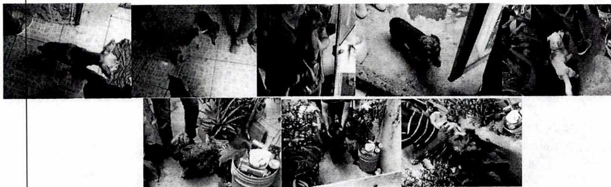
FOTOGRAFÍAS.- Vistas de los ejemplares caninos y de su lugar de alojamiento.

No obstante lo anterior, mediante el oficio correspondiente, se informó a la responsable de los animales en cuestión, las obligaciones que prevé la Ley de Protección a los Animales de la Ciudad de México al contar con animales de compañía, conminándola a su debido cumplimiento.