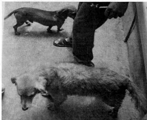
Se muestran a los ejemplares caninos motivo de denuncia.

Asimismo, al interior del inmueble son alojados 18 ejemplares felinos, de los cuales 10 son machos y 8 hembras; siendo 11 adultos de entre 1-15 años y 7 cachorros de 5 meses, con las siguientes características: