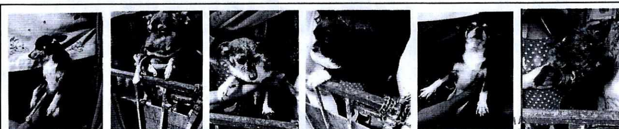
FOTOGRAFÍAS.- Vistas de los ejemplares caninos

Medellín 202, piso 4, colonia Roma Alcaldía Cuauhtémoc, C.P. 06700, Ciudad de México Tel. 5265 0780 ext 12011 o 12400