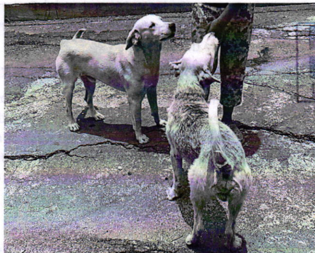
Fotografía 1. Vista de los ejemplares caninos que responden a los nombres de "Max" y "Jonny".

Medellín 202, 4to piso, colonia Roma Norte Alcaldía Cuauhtémoc, C.P. 06700, Ciudad de México Tel. 5265 0780 ext 12011 ó 12400