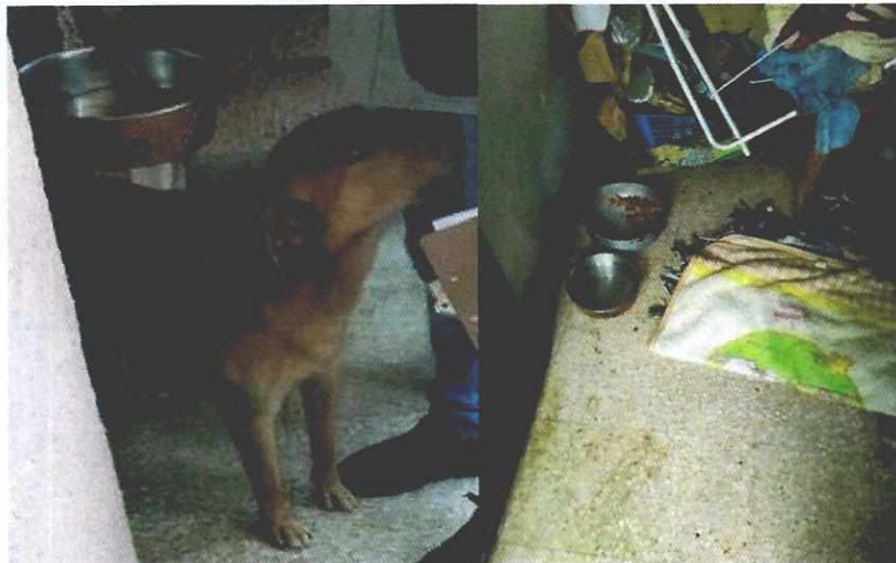
Fotografías.- Ejemplar canino motivo de la denuncia y sus condiciones de alojamiento.

Mediante oficio se hizo del conocimiento de la persona responsable del inmueble referido en la denuncia, las responsabilidades que se tienen que cumplir al tener animales de compañía, conminándola a su debido cumplimiento.